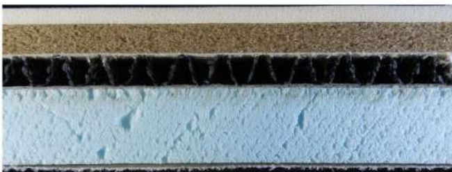
IR-IIAT55 の断面写真 (縮尺：1/2)