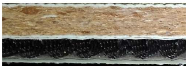
IR-ⅢAT30 の断面写真 (縮尺：1/1)